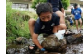
PTAいわなつかみ大会