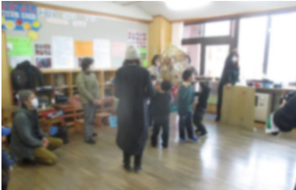
【1年生お祭りの様子】