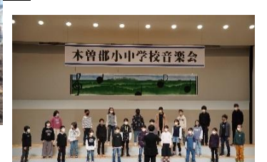
木曽郡小学生音楽会