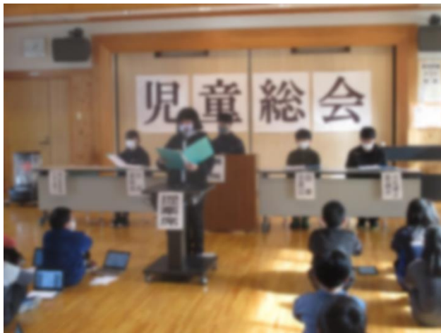
【児童会長のあいさつ】