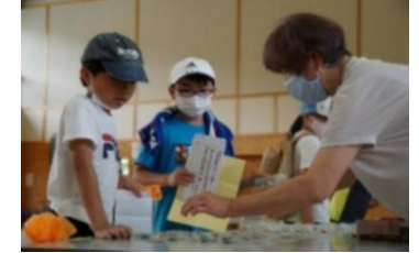
開田小応援団駄菓子屋横丁