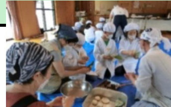
1・2年ほう葉まきづくり

5月 低学年遠足(1年~3年) 読書旬間 クラブ発足(通年) 馬耕 小中連絡・合同研修