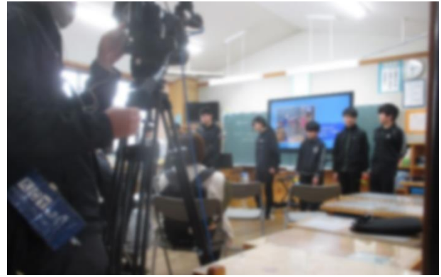
【6年生ケーブルテレビが取材】