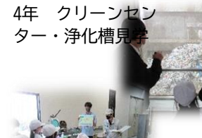
4年 クリーンセンター・浄化槽見学

11月 6年修学旅行 人権参観日 高学年車いすバスケ体験 CS月食観測会 4年イモリ先生来校 CSポッチャ大会 4年クリーンセンター見学