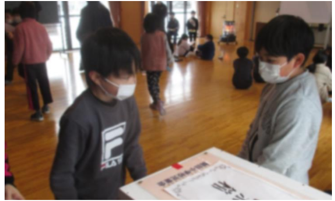
【3から6年生が投票しました】