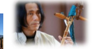
ホーミーと馬頭琴ライブ