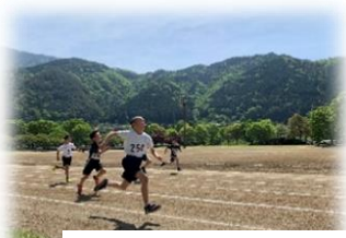
木曽郡小学生陸上大会