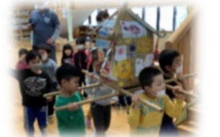
1年子ども園まつり