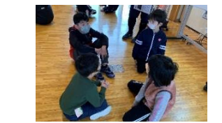
パワーアップタイム