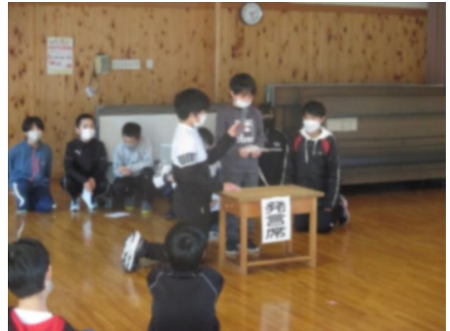
【多くの児童が意見を出します】

2月1日(水)に令和5年度児童会選挙の立ち合い演説会と、投票が行われました。児童会長候補からは「学年が違ってみんなが仲良く過ごせる学校」をスローガンに掲げていました。今年度パワーアップタイムやきそこの時間などで意識的に縦割り班の活動を増やしたことで、異学年の友だちを意識することになったのかもしれない。