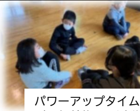
パワーアップタイム(異年齢集団の活動)

10月 5年長野市見学 CSマラソン大会草刈り作業 校内マラソン大会 全校芋ほり 2年移動松原商店 2年乗り物遠足