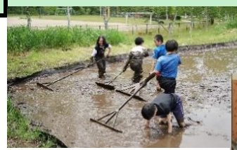
5年田んぼづくり(しろかき)

6月 青空給食 音楽会 CS校内整備作業 5年田植え 木曽町小学生相撲大会 5年新居小交流 1,2年ほう葉まきづくり 1年子ども園まつり 3年白菜畑見学